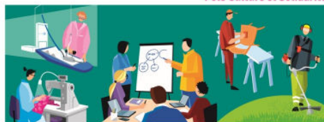
Pôle Orientation - Emploi - Formation