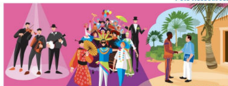
Pôle Culture et Solidarité