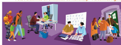
Pôle Asile - Réfugiés