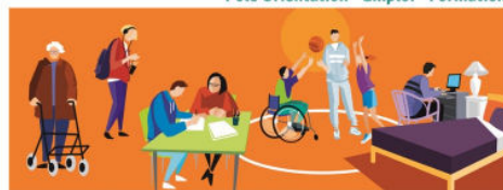
Pôle Personnes en Situation de Handicap - Personnes Âgées